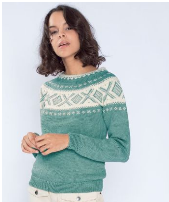
Se også i aqua grønn | DG410-02