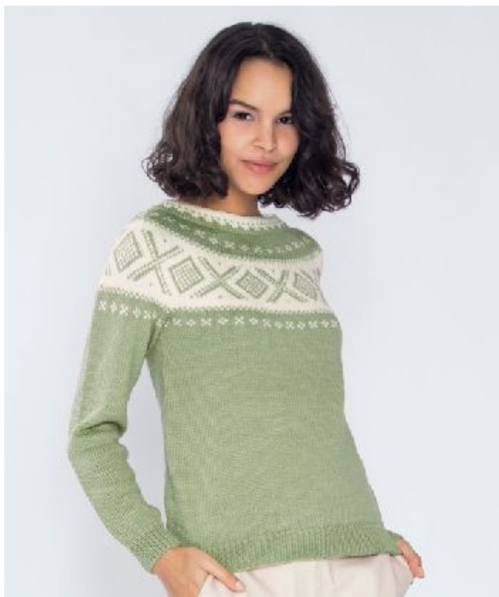
Se også i pistasj | DG410-01