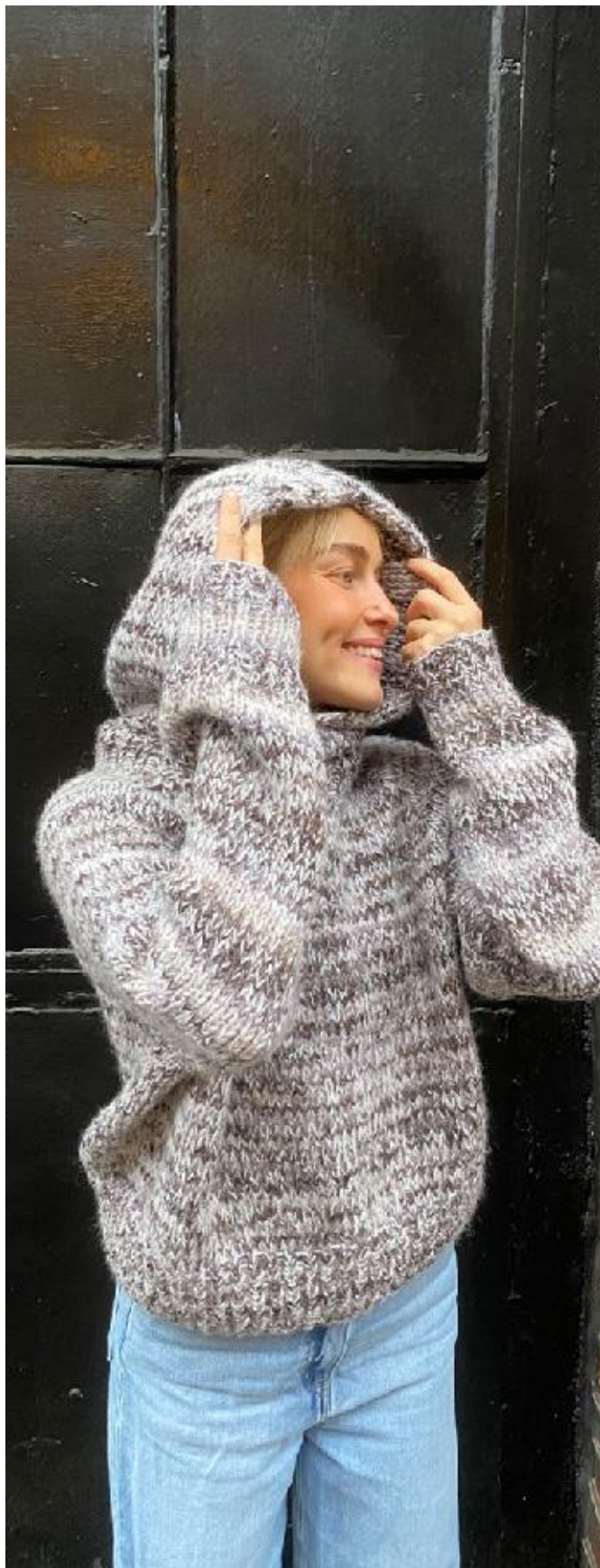
Bruk Øyunn balaklava sammen med Krogh genser, se gratis oppskrift på houseofyarn.no