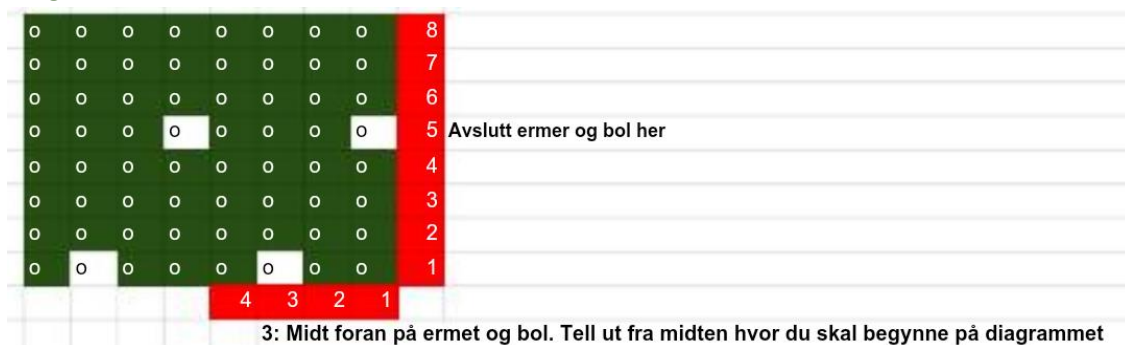
Diagram C (Bærestykket)