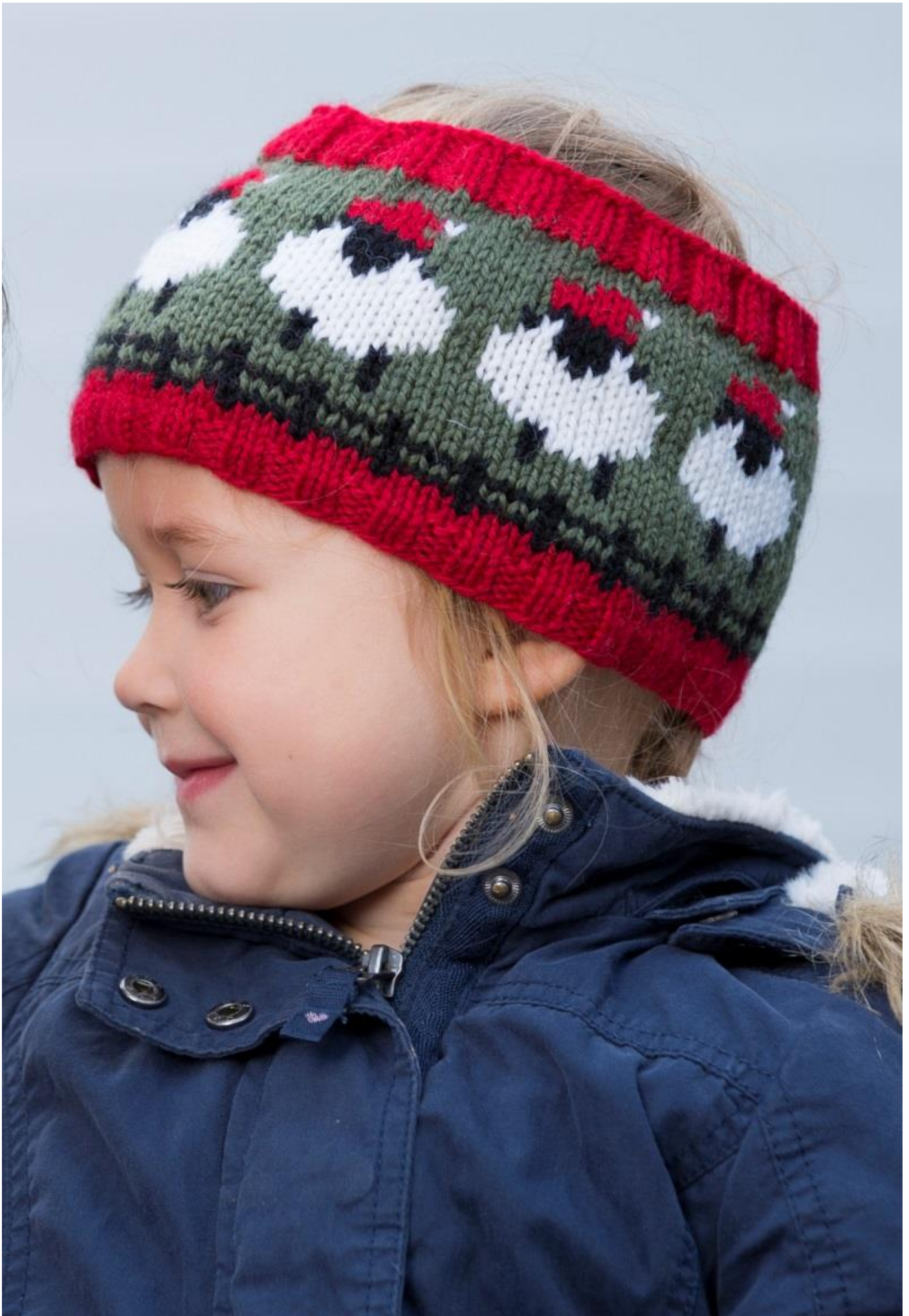
Design: Heidi Bollestad